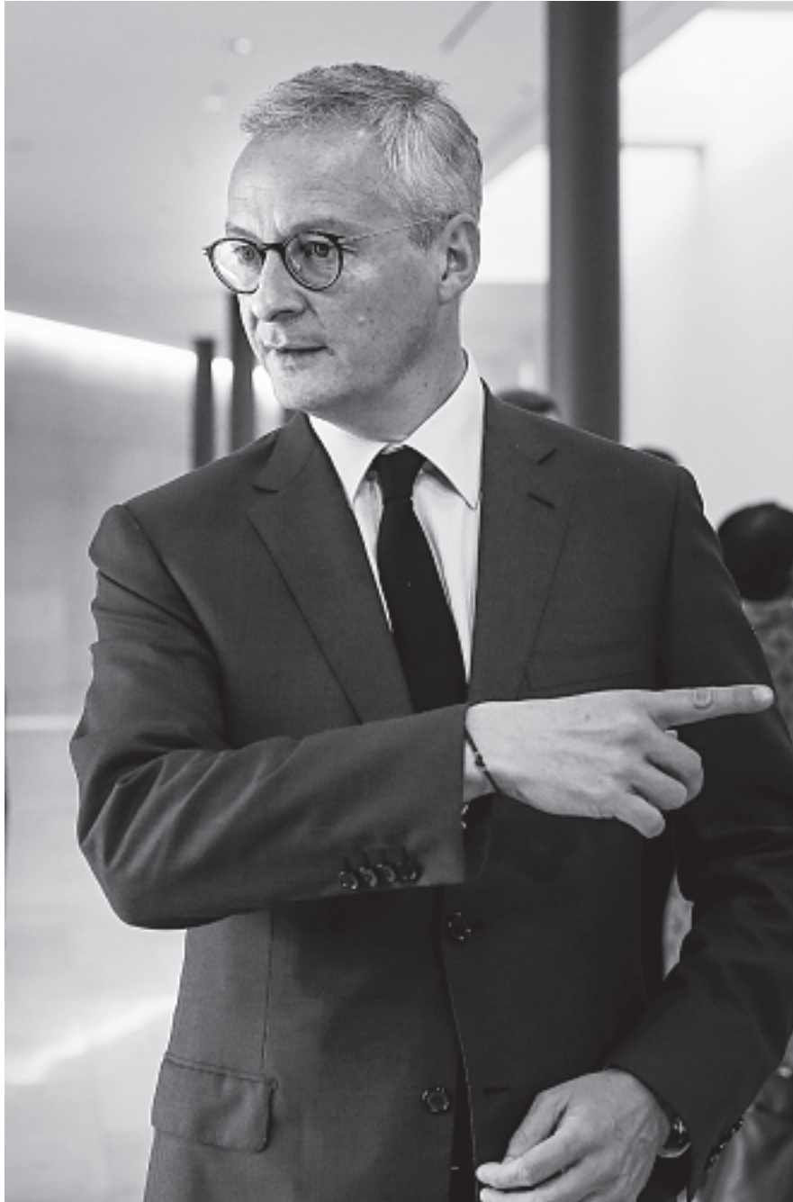
De Franse minister van economie, financiën en handel Bruno Le Maire

Geen grootschalige projecten dus. In het reeds geaccepteerde noodpakket is het Europese Stabiliteits Mechanisme (ESM) geactiveerd voor de gezondheidszorg en gerelateerde economische schade. Italië kan bijvoorbeeld voor ongeveer €38 mrd steun uit dit fonds krijgen tegen lage rente. Het 2% maximum van het bruto nationaal product van een lidstaat